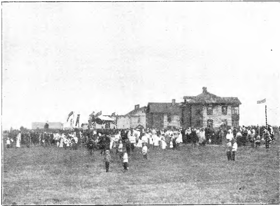
Освященіе мѣста для храма въ «Новыхъ Мѣстахъ» близъ ст. Гайцы. (Къ стр. 78).

— Свѣтлый, какъ мѣсяцъ на небѣ, Алей-Шнуръ!—