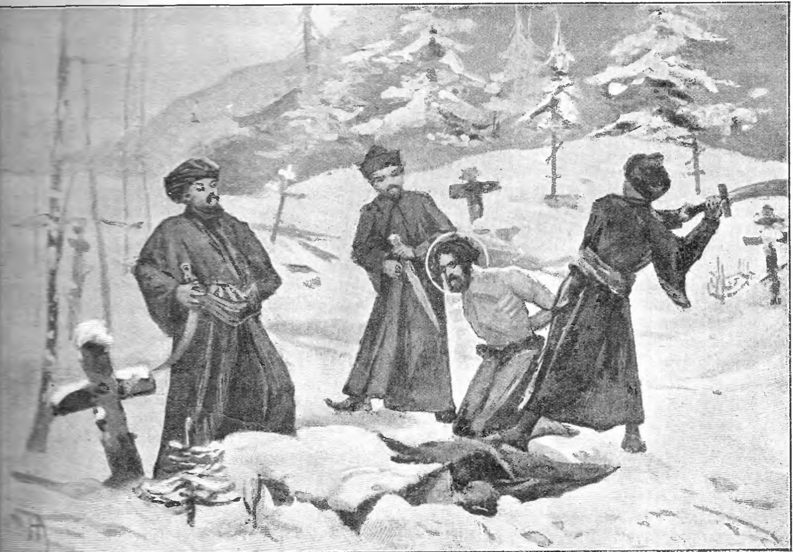
Св. мученикъ Іоаннъ Казанскій.

„Русскій Паломникъ“ одобренъ всеми вѣд-ствами.